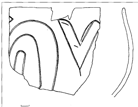
Fig. 1. Versierd Bandkeramisch aardewerk uit Stein, terrein Dirix, kuil 1 (StHv96X11-1)

Het betreffende terrein is gelegen in een delle die het